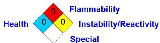
全国防火協会(米国)